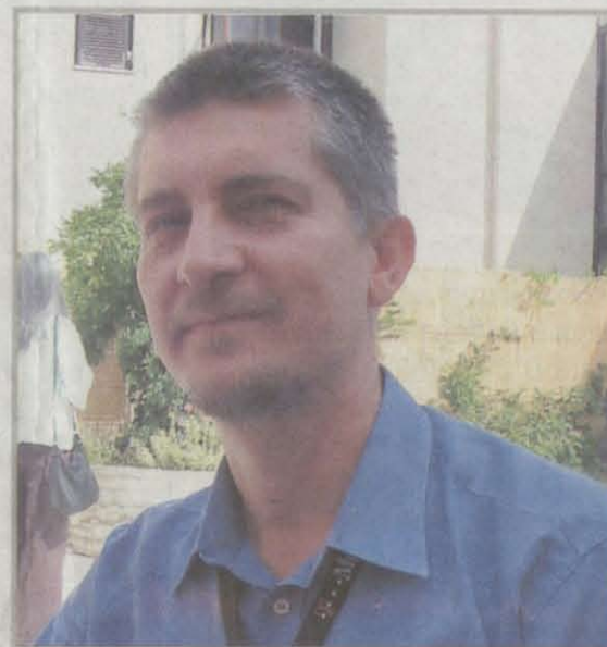
• Pacijent u posljednjoj fazi bolesti više uopće ne može sam funkcionirati, zbog čega bi trebalo otvoriti adekvatne domove, napomenuo je dr. Šimić